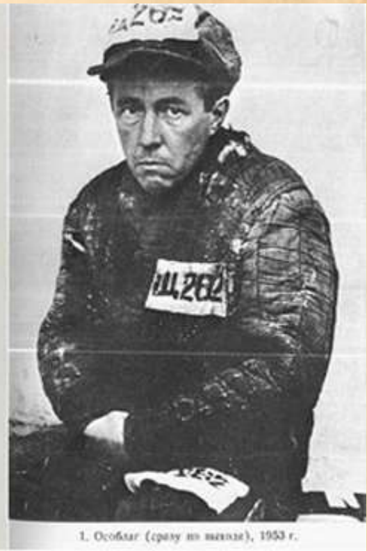
1. Особляк (справа от машины), 1953 г.

Небольшая повесть никому неизвестного 44-летнего сельского учителя, словно прорвала зацементированную плотину.