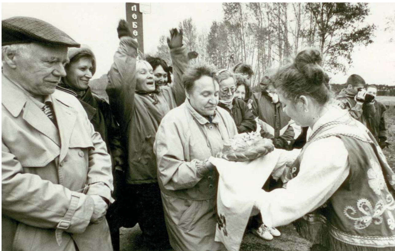
Замятинские чтения 1997 г.: встреча участников в Лебедяни