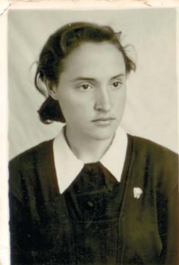
10 класс, Староюрьевская средняя школа. 1960 г.