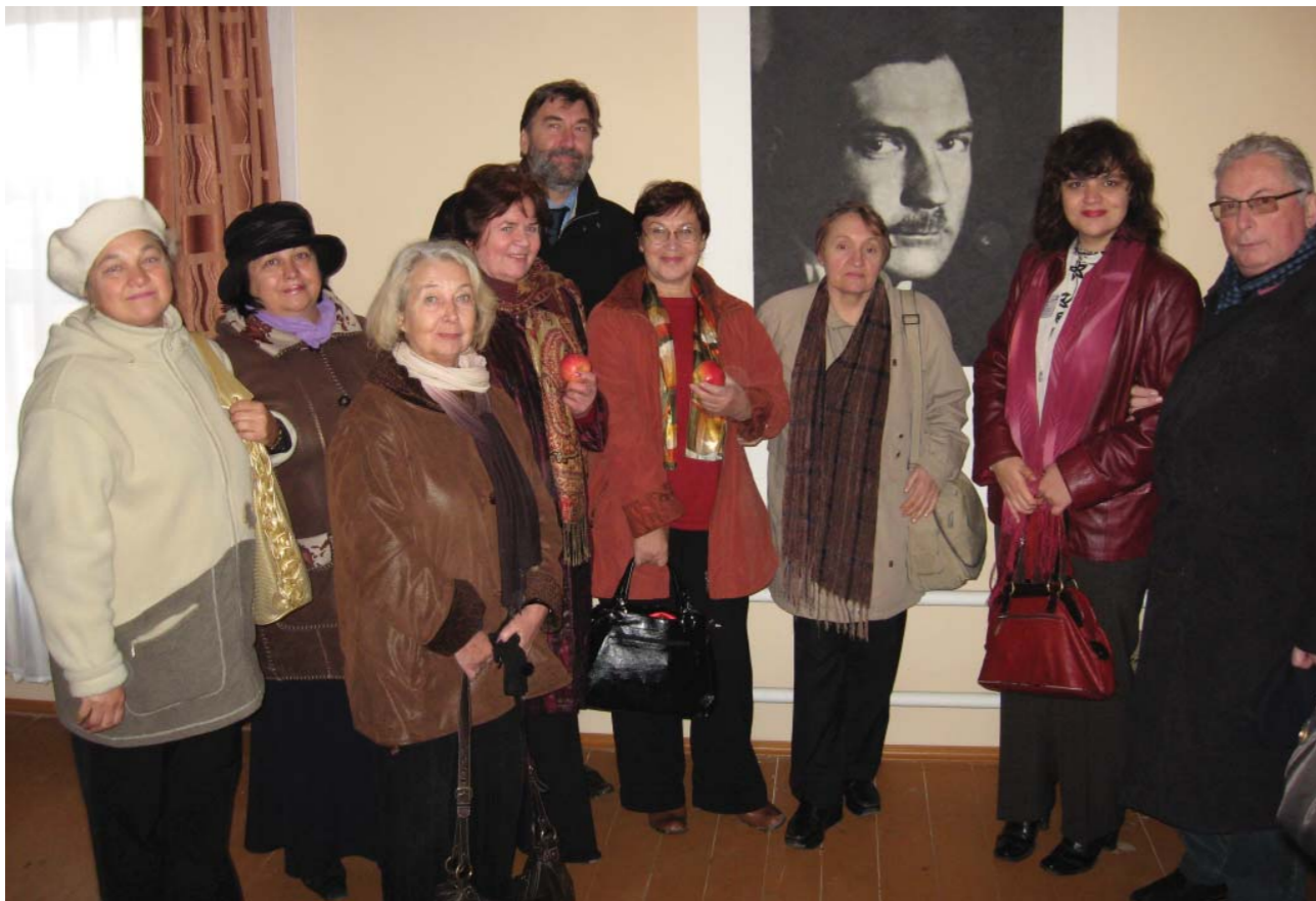
Открытие восстановленного Дома Е.И. Замятина в Лебедяни 9 октября 2009 г.

5–8 октября 2009 года состоялся Международный конгресс литературоведов, приуроченный к 125-летию Е.И. Замятина. Организаторами этого масштабного научного форума выступили Международный научный центр изучения творческого наследия Е.И. Замятина в Тамбове, его отечественные (Елец, Мичуринск) и зарубежные (Краков, Лозанна) филиалы, Институт мировой литературы имени А.М. Горького РАН. В программе конгресса заявлено более 130 докладов и научных сообщений российских и зарубежных исследователей. В работе форума приняли участие член-корреспондент РАН Н.В. Корниенко (Москва), проф. В.В. Агеносов (Москва), проф. Т.Д. Белова (Саратов), проф. Х. Вашкелевич (Польша), проф. Л.М. Геллер (Швейцария), проф. М.М. Голубков (Москва), проф. Гольдт (Германия), проф. Г.З. Горбунова (Казахстан), проф. К.Д. Гордович (Санкт-Петербург), проф. Гурленова Л.В. (Сыктывкар), проф. Т.Т. Давыдова (Москва), к.ф.н. А.А. Житенев (Воронеж), к.ф.н.