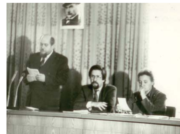
Первые Замятинские чтения, 1994 г.