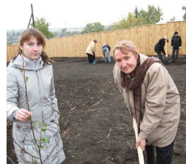
Закладка яблоневого сада в замятинской Лебедяни, 2009 г.

Помимо пленарных и секционных заседаний, были проведены два круглых стола: «Современное состояние преподавания литературы в вузе и школе» и «К выходу нового российского научного журнала "Филологическая регионалистика"» (издание Тамбовского университета). Участники и гости конгресса посмотрели презентацию книжного, документального и диссертационного фонда Международного Замятинского центра в Тамбове, насчитывающего несколько сотен уникальных единиц хранения. Самые яркие