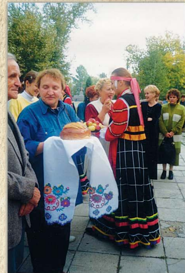
Замятинский город Лебедянь встречает участников тамбовских Замятинских чтений, 2002 г.