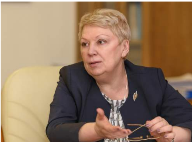
Министр образования и науки РФ Ольга Васильева:

«Я убежден, что отсутствие бюджетных мест или малое количество не должно препятствовать поступлению талантливой молодежи в вуз. В феврале этого года мы учредили гранты на обучение в Державинском университете по направлениям подготовки в сфере культуры и искусств, физической культуры. В дальнейшем мы планируем продолжать практику таких конкурсов, чтобы талантливые дети оставались в регионе».