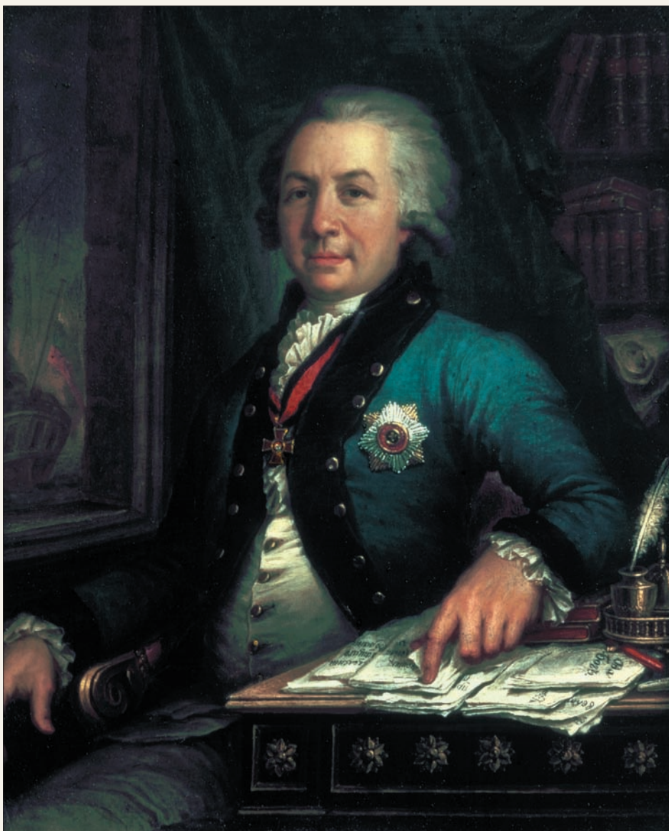
В. Л. Боровиковский. Портрет поэта Г.Р. Державина. Поэт изображен со звездой и шейным крестом ордена св. Владимира 2-й степени. На столе — рукописи наиболее известных державинских од.