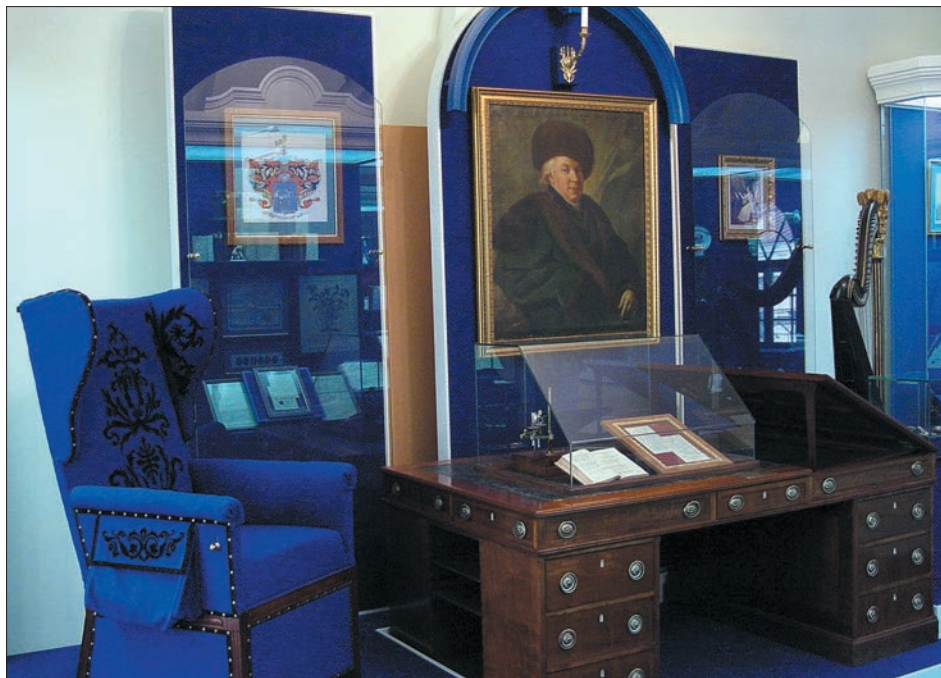
Кабинет Г. Р. Державина. Музейная экспозиция. НМРТ.

Памятник намечалось открыть в 1846 году, к 30-летию со дня смерти поэта, но