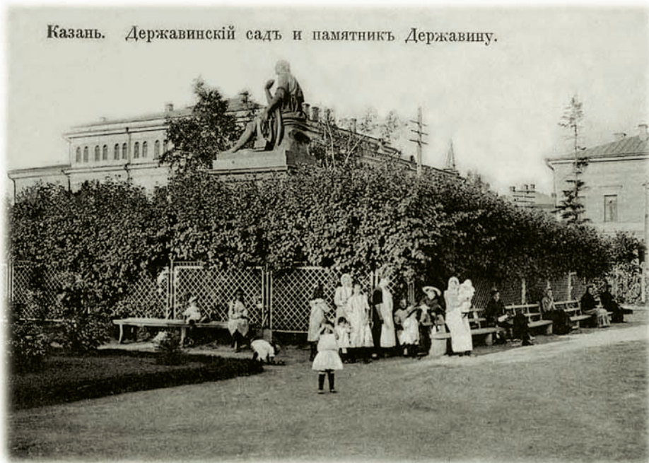
Казань. Державинский сад и памятник Г. Державину. Почтовая открытка начала XX в.