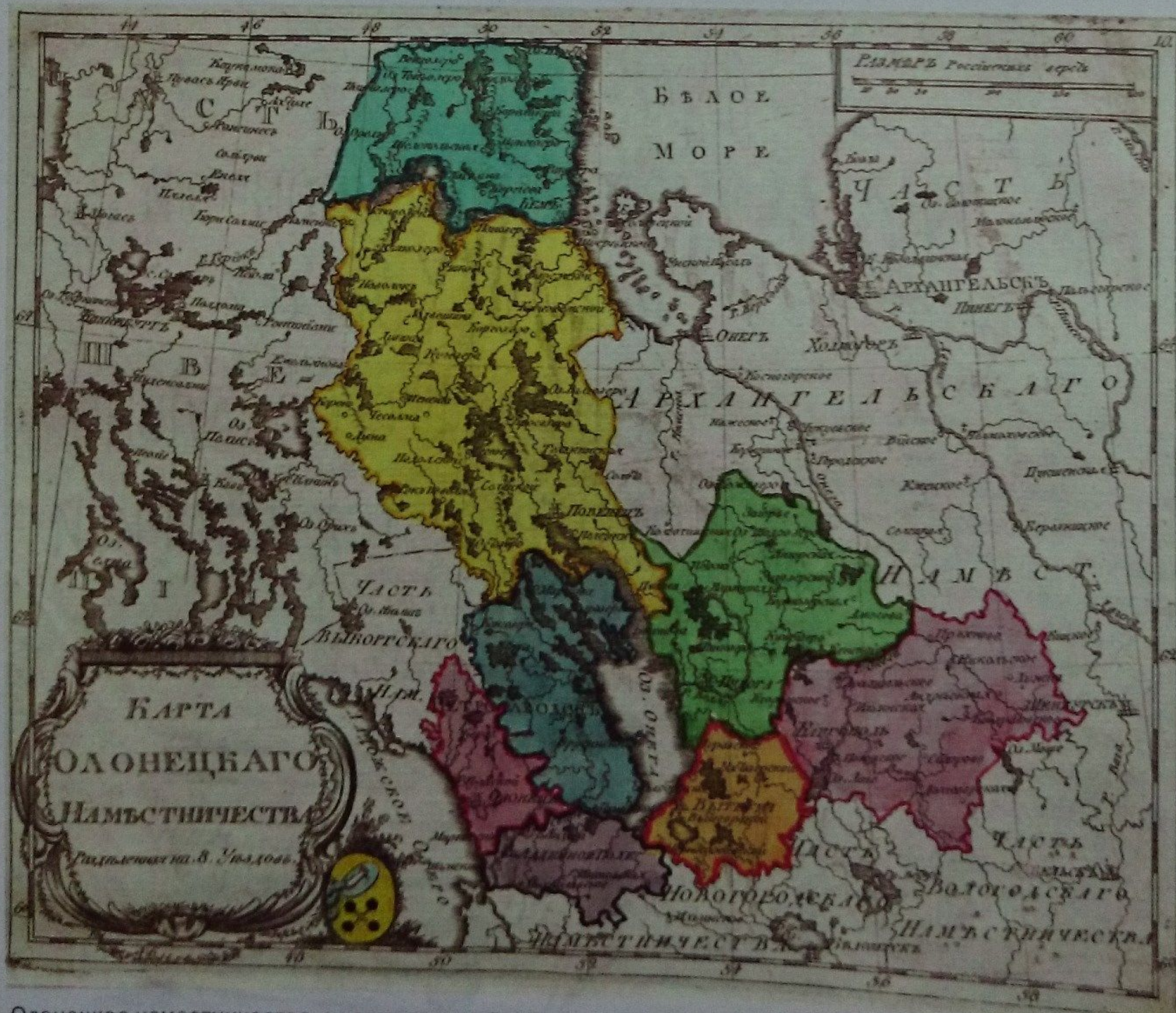
Олонецкое наместничество, в котором одной из губерний руководил Гавриил Державин, в XVIII веке было самым крупным на северо-западе России.

Генерал-губернатору в этой управленческой конструкции отводилась роль стратега-куратора: он не занимался рутинной, а обеспечивал «правильную линию» развития региона. На губернатора же возлагались тактические задачи управления вверенной территорией. И все было бы хорошо, если бы не частые конфликты между генерал-губернаторами и губернаторами на почве споров о разграничении властных полномочий. А происходили они из-за размытой формулировки закона, в тексте которого не было конкретных инструкций, как следовало действовать двум высшим чиновникам на местах в случаях спора и административных коллизий. Это вносило особый колорит в систему местного администрирования, порождало ка-