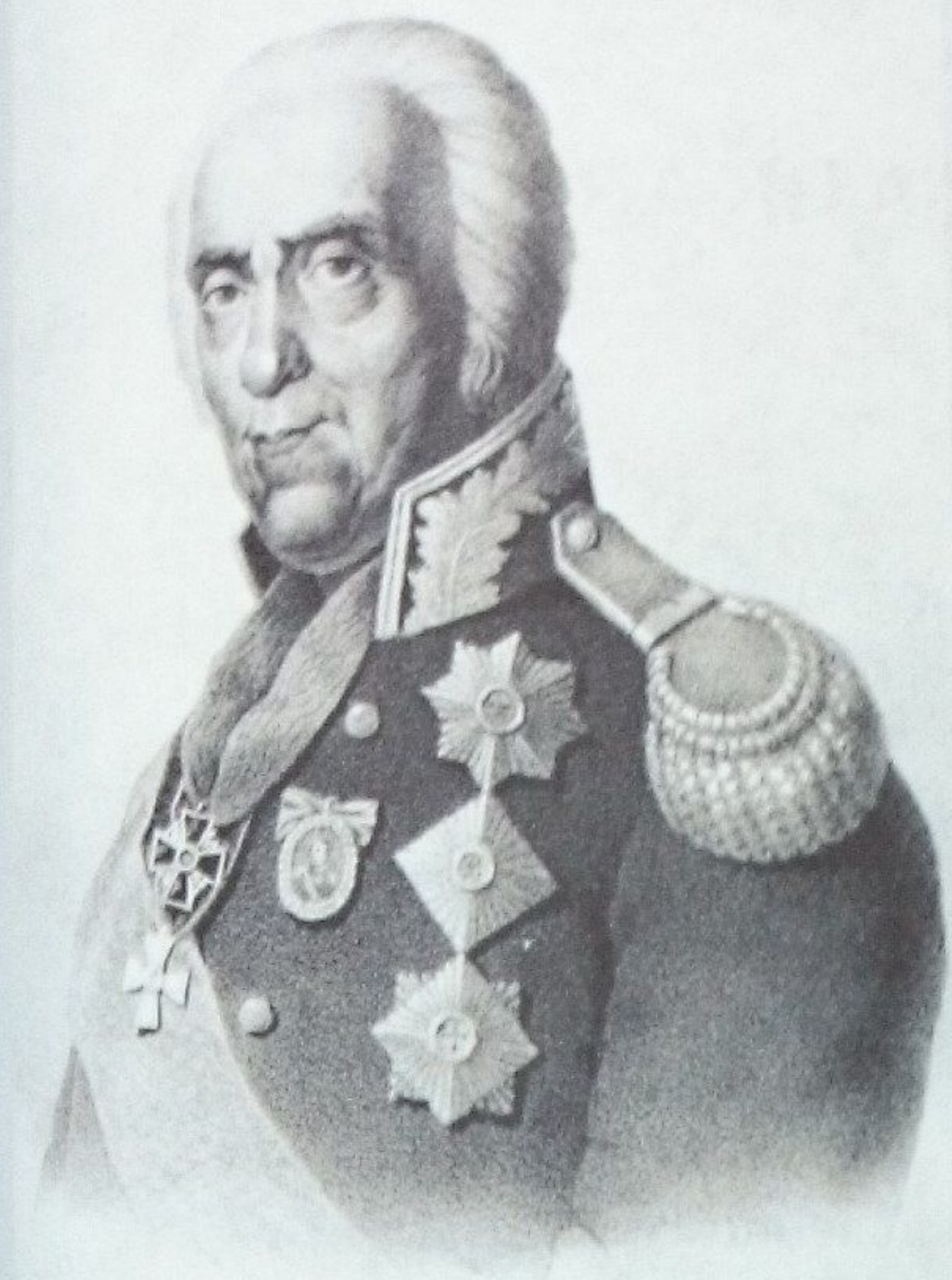
С генерал-губернаторами И.В. Гудовичем (слева) и Т.И. Тутолминым, которые возглавляли Тамбовское и Олонецкое наместничества, губернатору Державину приходилось немало конфликтовать по вопросам разграничения полномочий.