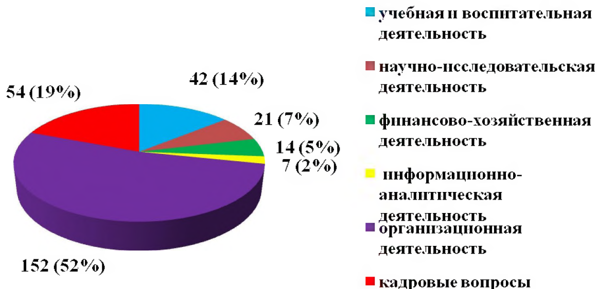
Рисунок 3. Структура вопросов, рассмотренных на заседаниях Ученого совета университета в 2021 году

В соответствии с запланированными мероприятиями, на заседаниях Ученого совета в отчетном году было рассмотрено 290 вопросов, связанных с основной деятельностью университета, относящихся к компетенции Ученого совета: вопросы об учебной и воспитательной деятельности, о научно-исследовательской деятельности, о финансово-хозяйственной деятельности, об информационно-аналитической деятельности, об организационной деятельности и кадровые вопросы (рис. 3).