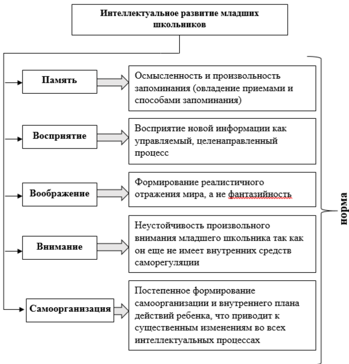
Рисунок 1. – Интеллектуальное развитие младших школьников

Детский интеллект в младшем школьном возрасте развивается комплексно по нескольким направлениям: усваивается и активно используется речь как главное средство процесса мышления; формируется образное и словесно-образное мышление. В интеллектуальном развитии обособливаются и развиваются относительно независимо друг от друга две основные фазы: подготовительная и исполнительная. Подготовительная фаза характеризуется анализом условий поставленной перед ребенком задачи и выработкой плана относительно ее решения. Исполнительная фаза направлена на практическую реализацию этого плана. Завершающим этапом является соотношение полученного результата с проблемой и условиями задачи, здесь также важно умение ребенка оперировать понятийным аппаратом и логически рассуждать [1, с.89].