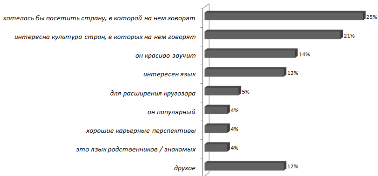
Рис. 2. - Причины выбора информантами языка в качестве второго иностранного

При этом туристской дестинацией участников опроса в первую очередь стала бы франкоязычная страна, наибольший интерес они проявляют к корейской культуре, наиболее красивым ими признается испанский язык.